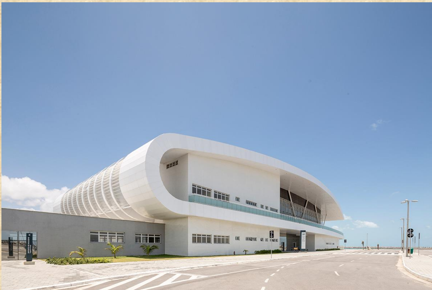
Exposição Naval no Terminal Marítimo de Passageiros