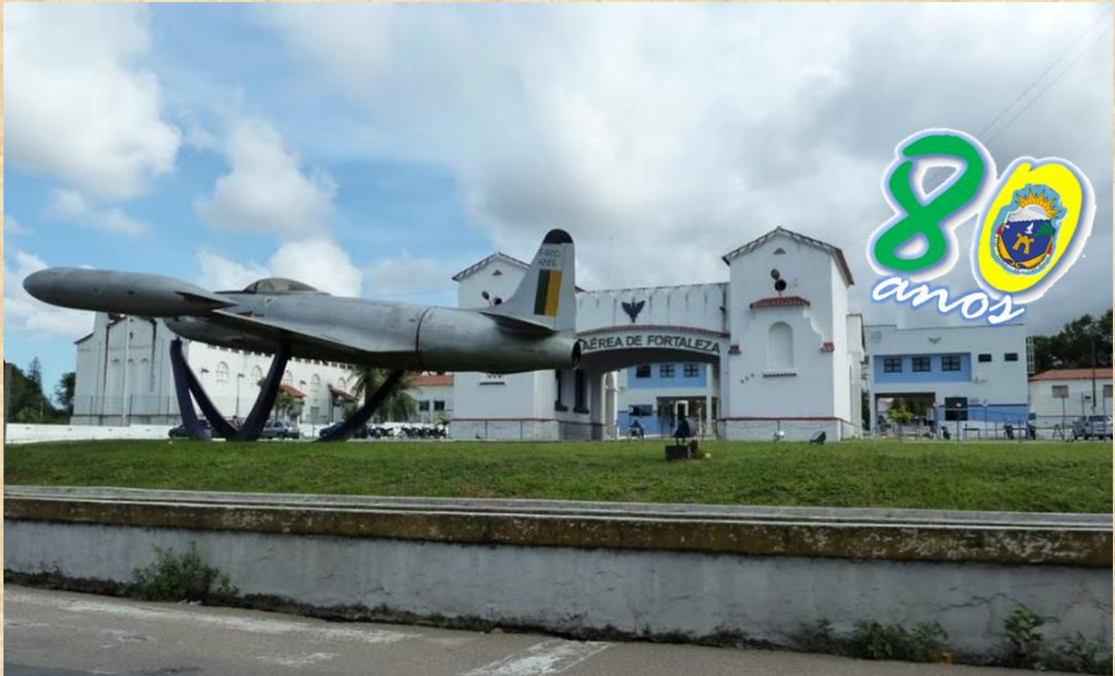
Visita ao Conjunto Arquitetônico da BAFZ