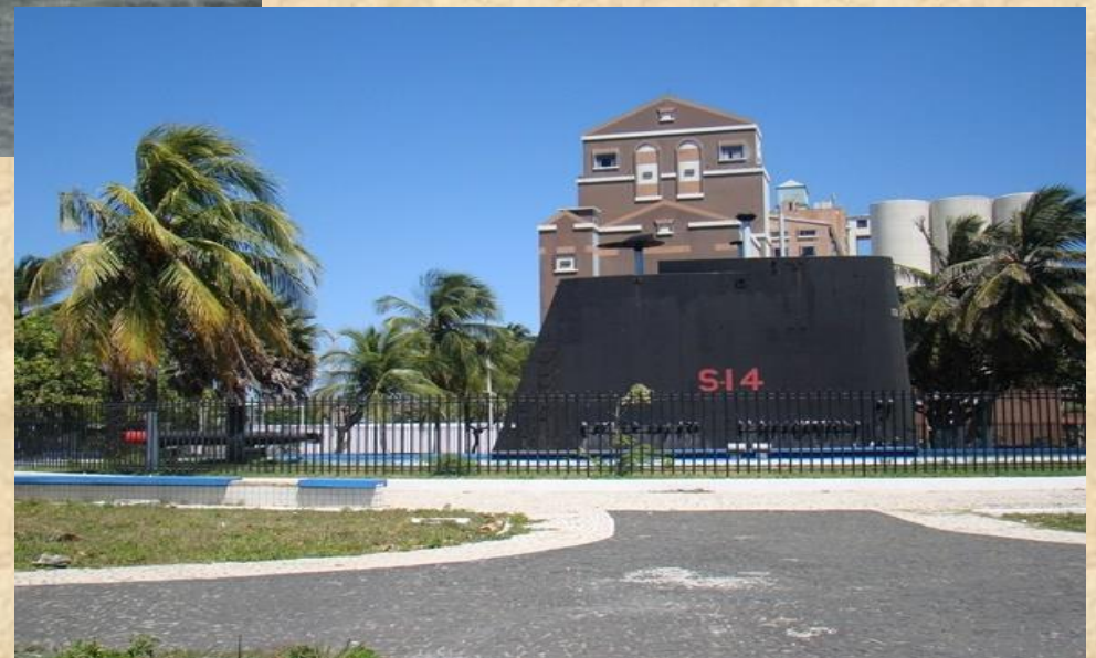
Visita à Praça Amigos da Marinha Monumento Vela do Submarino CEARÁ