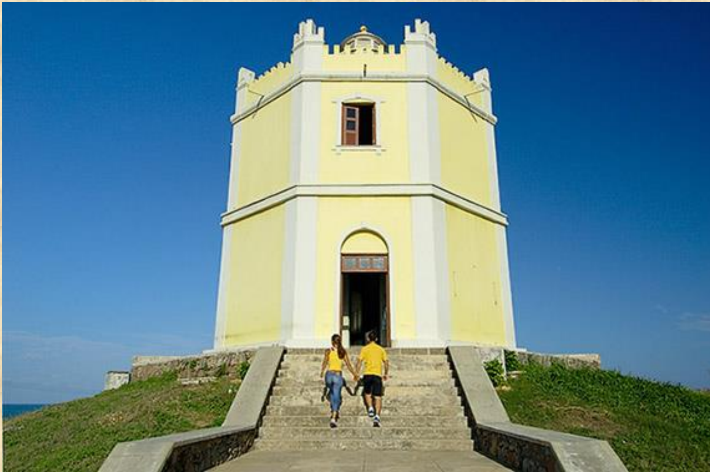
Visita ao Farol Velho do Mucuripe