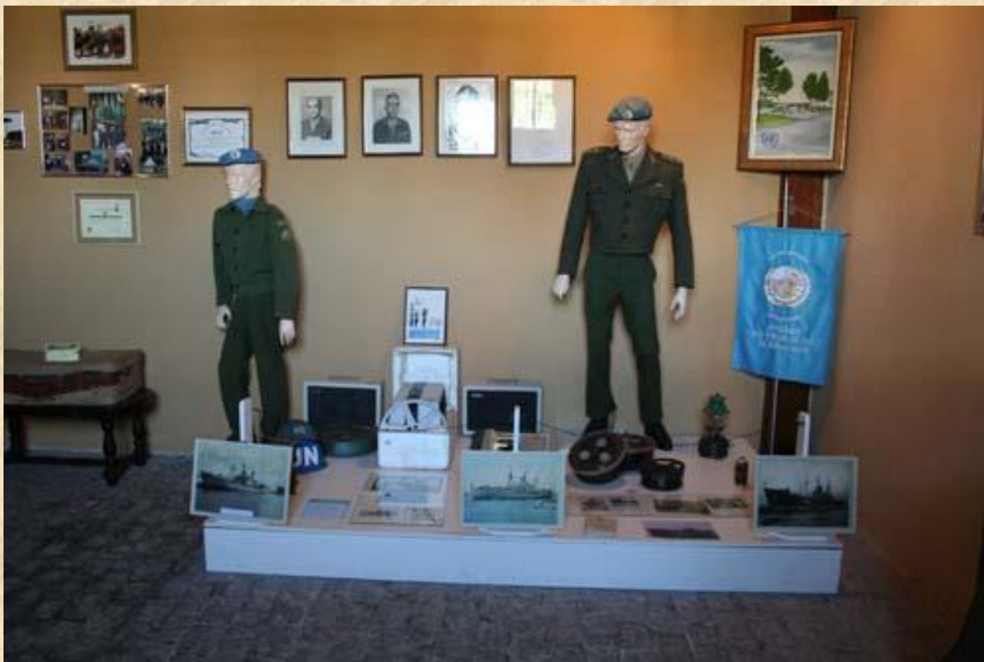
Visita ao 23º Batalhão de Caçadores Museu do Batalhão