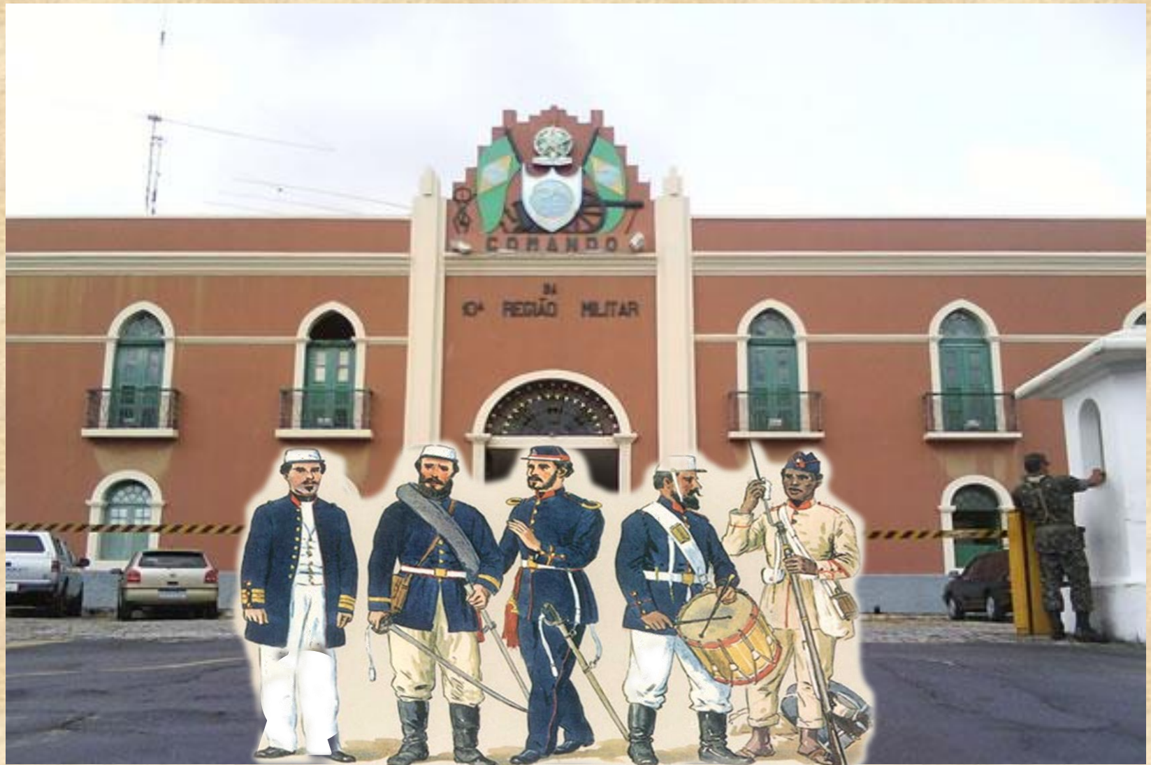
Troca da Guarda em Uniforme Histórico