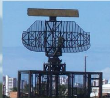
Radar 1°/5° GCC