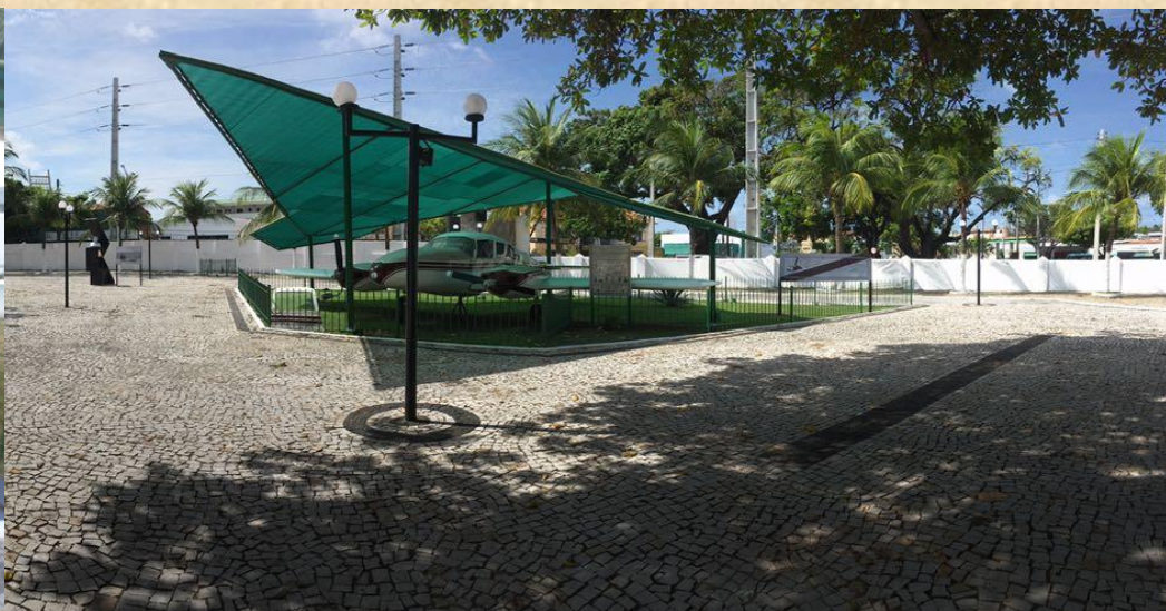
Visita ao 23º Batalhão de Caçadores Avião que vitimou o Marechal Castello Branco