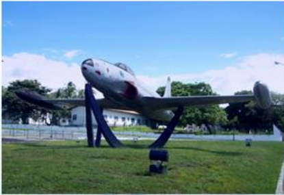
F-80C Shooting Star