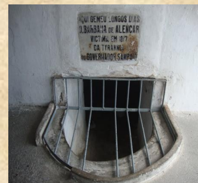
Visita à Fortaleza de Nossa Senhora da Assunção