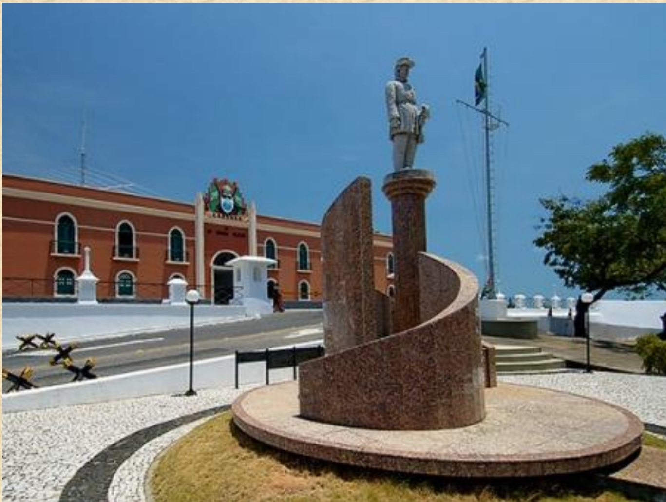
Visita ao Panteão de Sampaio